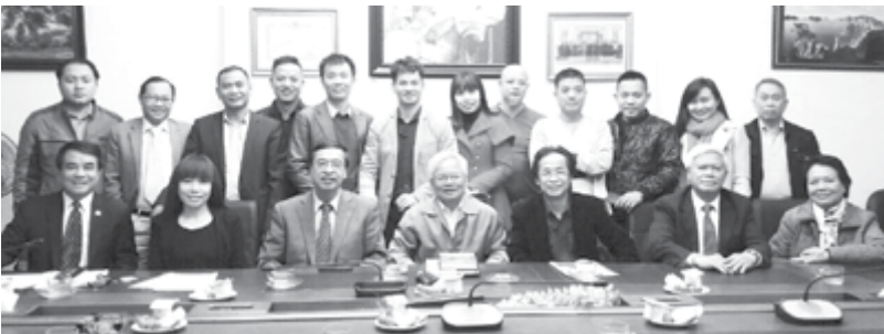
Đại diện Ban dự án Ngày Quốc tổ Việt Nam toàn cầu, họp năm 2017

(3) Thực hiện chiến lược quảng bá giá trị/thương hiệu Việt trên toàn cầu, thông qua môi trường thực tế và thực tế ảo - môi trường báo chí - truyền thông quốc tế (một cách hệ thống, đồng bộ, toàn diện và thường niên).