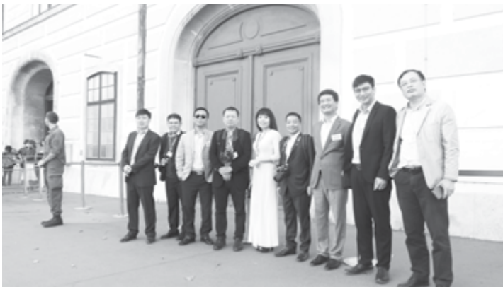
Tác giả và Đoàn nhà báo Việt Nam tháp tùng Thủ tướng Nguyễn Xuân Phúc

Cánh nhà báo chúng tôi đến sớm, đứng chờ trong khu vực báo chí, trước Phủ Thủ tướng Áo, hàng quân danh dự cũng đã nghiêm trang chờ đợi. Tôi vừa đặt túi xuống cạnh cột điện thì một bạn đồng nghiệp Áo đã đi đến bắt tay chúc mừng. Chúng tôi bèn đứng tránh ra một góc để trò chuyện. Đột nhiên, một người đàn ông bước đến nhìn chăm chú vào bên trong chiếc túi của tôi (chiếc túi mở khóa), rồi rút phù hiệu cảnh sát ra hỏi: “Đây có phải là túi của các cô không?”. Chúng tôi mỉm cười xác nhận và đứng gần lại chỗ để túi. Hóa ra họ sợ bị đặt bom! Các đồng nghiệp Áo hỏi tôi cách đánh vần họ tên của Thủ tướng Việt Nam, còn các đồng nghiệp Việt Nam thì hỏi tôi cách đánh vần họ tên của Thủ tướng Áo, tôi cũng đã giới thiệu đồng nghiệp của hai nước với nhau. Chúng tôi trò chuyện và chụp ảnh kỷ niệm.